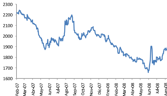
Tasa de Cambio Peso/USD

En la jornada del martes se esperan movimientos adicionales al alza, con un nivel de resistencia importante en $1.964 por dólar.